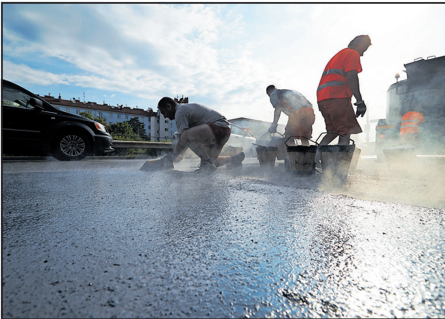
Unser Autobahn- und Schnellstraßennetz ist seit 1995 um 25 Prozent gewachsen, während das Schienennetz schrumpfte.

Alle wollen das Klima schützen. Doch spätestens beim Autoverkehr hört sich der Spaß auf. Nirgends sonst gibt es so viele Ausreden aus so vielen Lagern, um auch in Zukunft an einem Irrweg festhalten zu können.